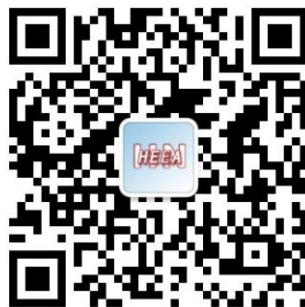
“河南省教育考试院”微信公众号二维码